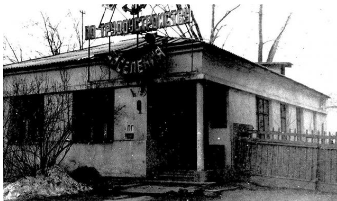
Рисунок 1. «Дом Рындина» (Фото 1989 г.)

На примере «Дома Рындина» мы можем рассмотреть, как с годами менялся внешний облик здания. На рисунке 3 можно увидеть, что после реставрации здание уже не соответствует стилевым рамкам конструктивизма, так как желтый цвет не вписывается в его цветовую гамму. Для конструктивистских зданий характерны белые и серые цвета.