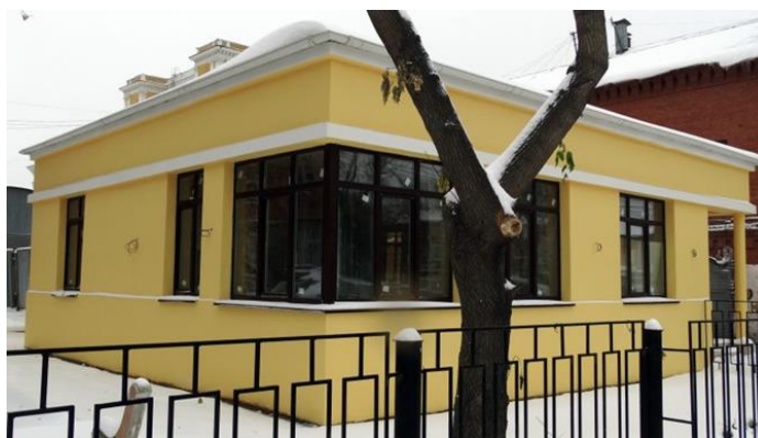
Рисунок 3. «Дом Рындина» (Фото 2014 г.)

В ходе исследования нами был проведен социологический опрос среди молодежи Челябинска. Нами было опрошено 97 студентов образовательных организаций высшего образования посредством интернет-опроса возрастом от 17 до 26 лет.