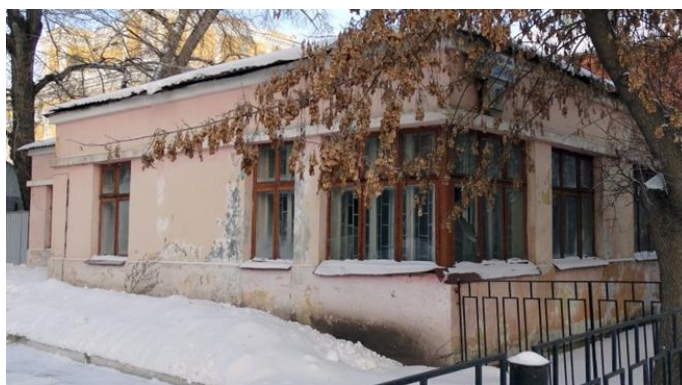
Рисунок 2. «Дом Рындина» (Фото 2013 г.)