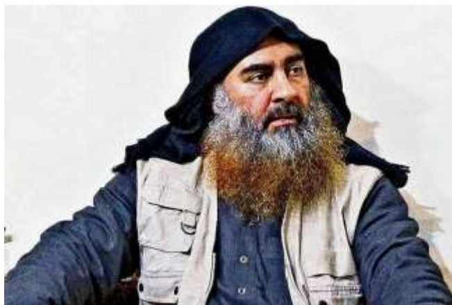
Рис. 3. Абу Бакр Багдади