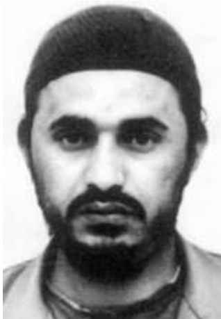
Рис. 2. Абу Масаб Заркави

Исламист Абу Масаб Заркави (Рис.2) организовал в Ираке «Аль-Каиду», а после его смерти в 2006 году эта группировка переросла в «Исламское государство Ирака» (ИГИ). В начале 2010 года во главе группировки встал новый лидер – Абу Бакр Багдади (Рис.3) скооперировался с исламистами, воюющими против Башара Асада, и в 2013 году сформировал «Исламское государство Ирака и Леванта» (ИГИЛ).